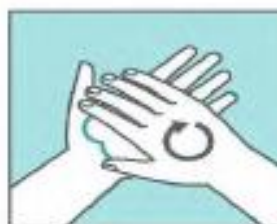
Frótate las palmas de las manos