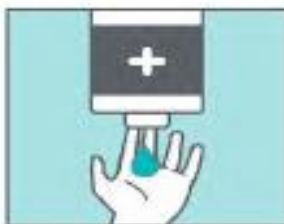
Deposita la cantidad suficiente de jabón en las palmas