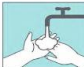
Enjuágate las manos con agua