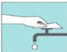
Usa la misma toalla para cerrar el grifo