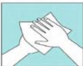
Sécate las manos con una toalla desechable