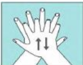
Frótate las palmas con los dedos entrelazados