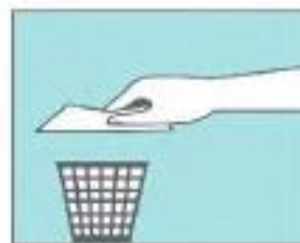
Tira la toalla a la basura