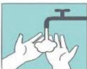
Mójate las manos

Sigue estos pasos durante el lavado de manos: