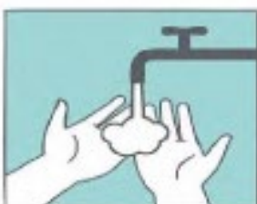
Mójate las manos

Sigue estos pasos durante el lavado de manos: