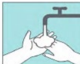
Enjuágate las manos con agua