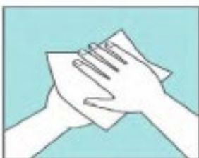
Sécate las manos con una toalla desechable