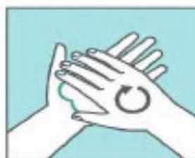
Frótate las palmas de las manos