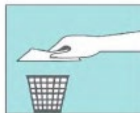
Tira la toalla a la basura