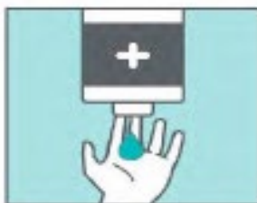
Deposita la cantidad suficiente de jabón en las palmas