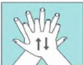
Frótate las palmas con los dedos entrelazados